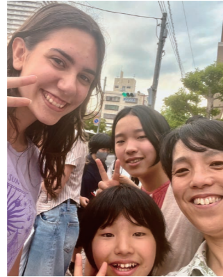
帰国後も時々オンラインで話したり、一緒にマイクラで遊んだり。6時間の時差を感じない距離感です。