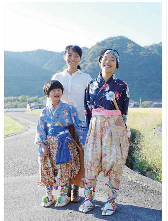
長女は昨年から獅子舞に、次女は笛にチャレンジ。七社八幡宮でも多くの人でにぎわい、子どもも大人も大活躍でした。

複数の施設でお聞きしました。福祉や教育の現場でも、そのような子どもに向きあい、サポートに尽力されていますが、より専門的なトラウマケアとして、心理の専門家が支援していくことも必要だという声を、