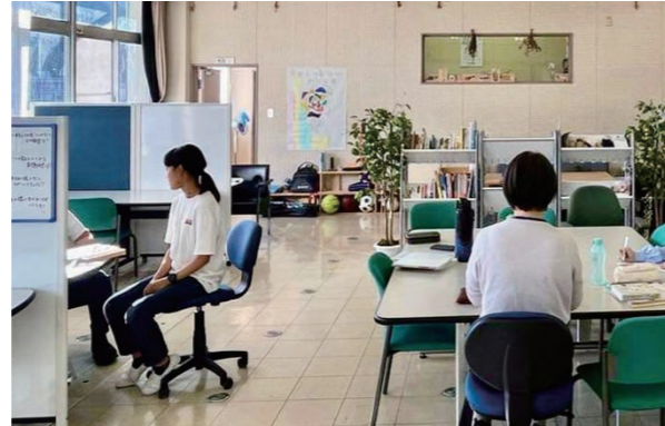
岡山御津高校内にできた「マイプレイス」は、不登校の中学生が楽しく先生と活動できます。

て恐怖を感じたという内容が多く見受けられ、また、長時間座ったまま板書ばかりの一言授業や、絶対こうしなさいと押し付けられる指導に理不尽さを感じたり、一方通行の学びにワクワクできないという答えもありました。また、子どもの発達障がいなどについての回答も多く、大きな音に対する感覚過敏、こ