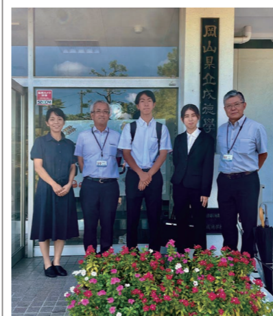
インターン学生と成徳学校へ。今も夫婦制で生活を共にされ、さまざまな困難を抱える子どもたちを支援されています。

では、獅子舞や神楽の練習が夏休み明けから始まり、娘たちは楽しそうに練習に通い、当日は二日かけて地区のすべてのお家を一軒一軒まわって、獅子舞や棒使いが演じられました。地域の繋がりが希薄になりつつある現代ですが、昔ながらのお祭りが続き、子どもたちが文化を受け継いでいけることはとても貴重だと感じます。