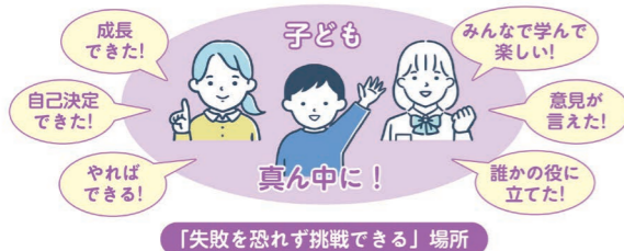
「新岡山県不登校総合対策」リーフレット(教員用)より

① 学校を、子どもたち誰もが通いたくなる魅力ある場所とします。 授業や学校行事、校則の在り方などを振り返り、これまでの教師主導の教育活動から、子どもを真ん中にした教育活動へ転換しましょう。