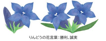
りんどうの花言葉:勝利、誠実