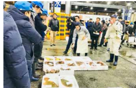
岡山中央卸売市場の初セリ。毎年楽しみに伺います（1.5）

これからも働きかけます。2009年度に食品数ベースで41%だった岡山市学校給食の地産地消率が、2018年度には51%になりました。岡山市は農水産物に恵まれた都市です。よさをさらに伸ばしたいです。