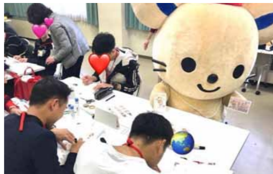
総社市の「地域でつながる日本語教室」。訪問時のテーマは「年賀状」。皆さん、熱心&楽しそうでした（12.22）

A: 現在の日本語教室にあわせて生活に密着した内容を学ぶ機会を、来年度から西川アイプラザ友好交流サロンで実施する。必要なら文化庁の事業も検討したい。