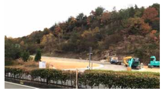
着々と建設が進む岡山北斎場への進入路

が異なり、風向きが異なると地元の人が言われている。風向きの調査を予定地で行い、再度環境影響調査を行わないか。