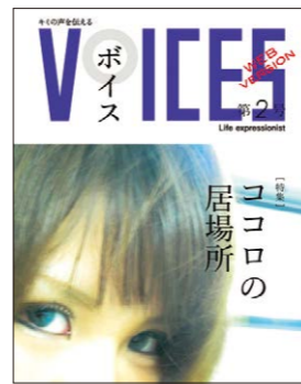
女の子の声が続けられた「VOICES」。生きづらさを抱える女の子の支援を行うbondプロジェクト刊。 http://bondproject.jp Instagram「bondproject」

大人への信頼感が持てない若年女性は、困っていても誰かに相談するということができず、支援が必要なほど支援につながらない現状があります。また、収入を得る手