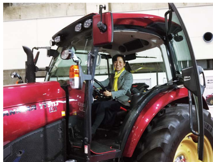
おかやまテクノロジー展にて、岡山市内で作られたトラクターに試乗。

足を運んでみると、そこでは岡山県暮らしに関わるいろんなテーマが議論されています。たとえば前回の11月議会では24名の議員による113項目の質問が出されました。印象に残ったテーマをいくつか紹介します。「県立高校のクラス数維持」、「新規看護師の離職防止」、「おかやま農業女子の若者との交流」、「就労継続支援A型事業所の再発防止」、「人口減少対策に関する有効求人倍率の分析」、「災害時のJR