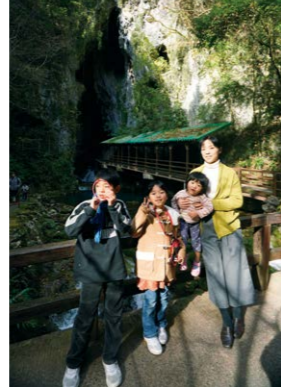
自然の中で子どもと過ごせる時間は大事です。

応じてちゃんとブレーキが踏める気持ちの切り替えや、夫婦の協力が不可欠ですが、それらを許せる職場環境や社会の寛容さも少しずつ増えてほしいな、と思っています。