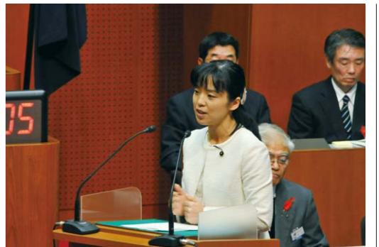
5度目の登壇。前回よりもしっかり話せました。

皆さんは県議会の傍聴をご覧になったことがありますか? なかなか行きにくい場と感じるかもしれませんが、いざ