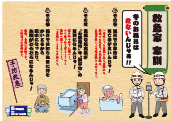
岡山市消防局製作のポスター。バス車内に掲示

こども時代からつながると、その先々もつながっていける。高齢者だって一人ぼっちもいる。こどもを中心に多様な人と出会います。人と人との温かいつながりを作り、「助けて」と言える地域づくりを目指しましょう。