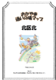
『おやかま通いの場マップ』に「認知症カフェ」などとともに掲載。